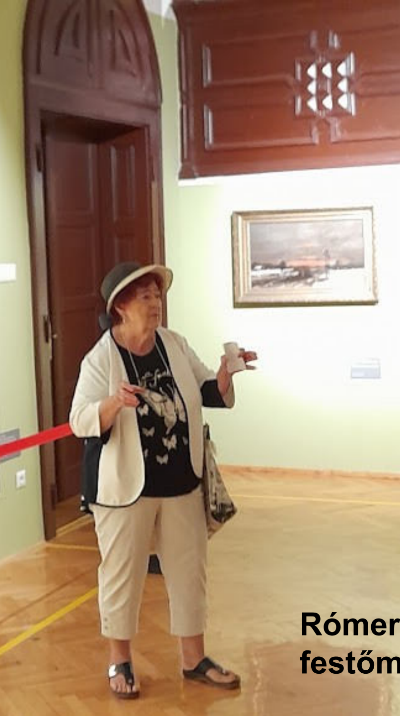
Rómer Ilona festőművész